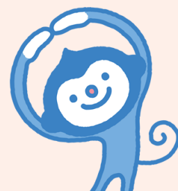
糖尿病協会マスコット：マールくん