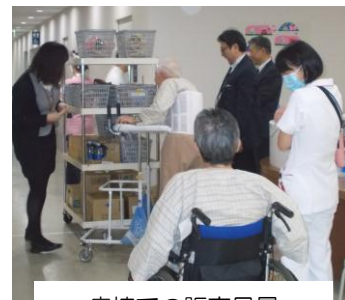
病棟での販売風景