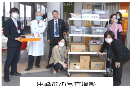
出発前の写真撮影

組合員さんの協力・援助を伝えるニュースは職員にとっても無類の励ましとなっています ありがとうございました。