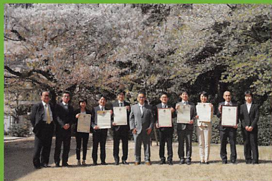
第6回「あいち介護サービス大賞」 入賞事業所による知事表敬訪問 (平成31年4月11日・愛知県公館)